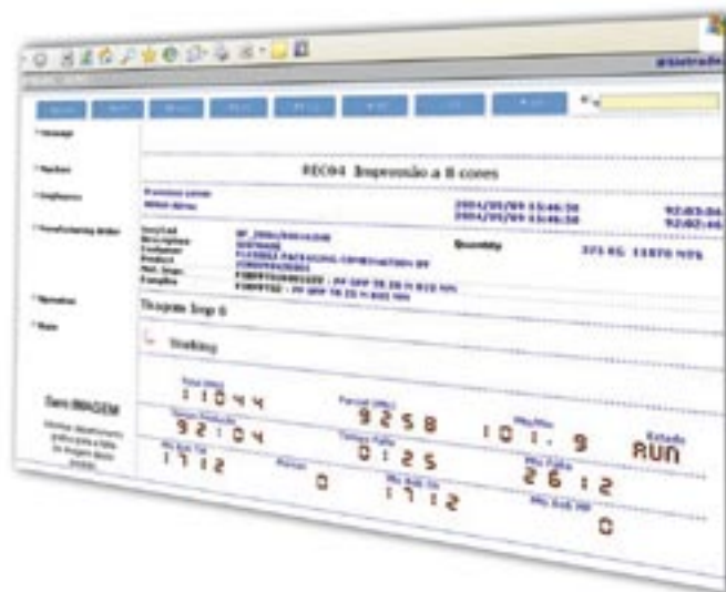
Alcune schermate delle soluzioni proposte da Sistrade

Sistrade, Angulusridet S.A. sviluppa soluzioni software integrate specifiche per le industrie grafiche e dell'imballaggio. Fin dalla sua fondazione, nel 2000, la filosofia di Sistrade è stata di creare soluzioni specifiche rispetto alle necessità di ogni singolo utilizzatore finale, ricorrendo a strumenti di sviluppo standard presenti sul mercato e in ambiente al 100% Internet. Dopo aver consolidato la propria presenza nel mercato portoghese, a partire dal 2003 Sistrade ha iniziato un processo di espansione internazionale, attraverso la vendita delle sue soluzioni in altri paesi e la partecipazione alle principali fiere ed eventi internazionali, quali Drupa, IPEX, Interpack, Graphispag, e più recentemente Grafitalia, Poligrafia.