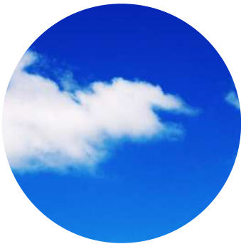
Basado en la Nube