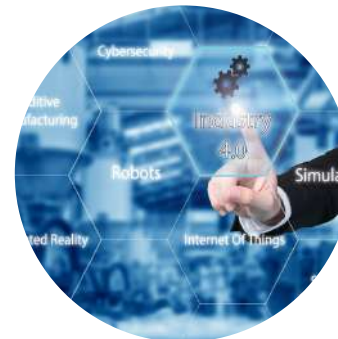
Integración en toda la empresa