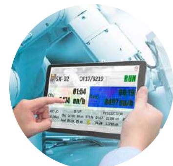
Monitoreo en tiempo real